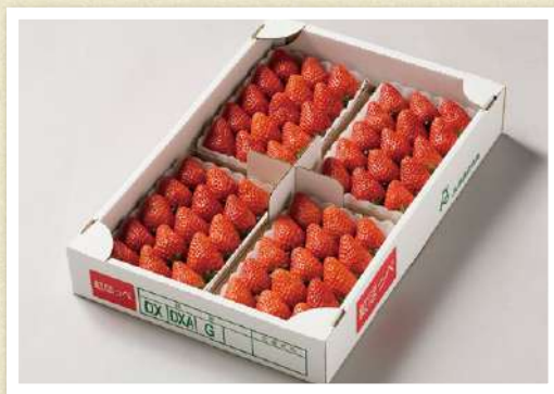
画像はイメージです

果肉の中まで鮮やかな「紅色」と、「ほっぺ」が落ちるほどおいしいことから、この名称が付けられたと言われています。果実は大きく鮮やかな赤色で、美しいツヤがあるのが特徴です。強み甘味とさわやかな酸味、芳醇な香りが楽しめるとして、人気の品種の1つです。