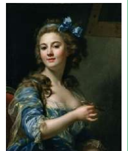
マリー=ガブリエル・カベ(自画像) 1783年頃、油彩/カンヴァス、国立西洋美術館

※中学生以下、心身に障害がある方及び付添者1名は無料。 ※入館の際に学生証または年齢の確認できるもの、障害者手帳をご提示ください。 ※観覧当日に限り本展の観覧券で常設展もご覧いただけます。