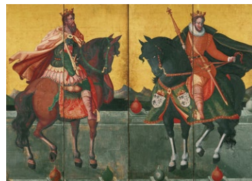
重要文化財 泰西王侯騎馬図屏風 四曲一双のうち左隻 桃山時代 17世紀 サントリー美術館 【展示期間: 4/17～5/13】