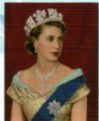
Queen Elizabeth II by Courtney Whiting, hand-coloured by William Hollar and George Hollar / National Portrait Gallery

【料 金】 a.10月平日入場可能券 会員一般 900円 (当日券 1,800円) b.10月土日祝入場可能券 会員一般 1,200円 (当日券 2,000円) c.11月平日入場可能券 会員一般 900円 (当日券 1,800円) d.11月土日祝入場可能券 会員一般 1,200円 (当日券 2,000円)